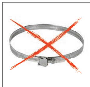
keine Spannband erforderlich