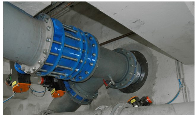
进水和排水管道——修整过的过滤池管道

这项工程的任务是对20世纪50年代的一个旧水厂中的管道进行修整。在施工中对包括过滤池管道接口在内的整个设施进行了改造翻修（混凝土墙厚30-45厘米）。工程的一大要求是，在密封新系统时不是将其浇固在混凝土中，而是通过一个环形密封元件密封安装到过滤池中。工程中特别注意到的一点是，确保必要时可以在设备运行期间从操作侧对两个密封装置进行后期夹紧。环形双密封元件的尺寸按照现场的管道直径250-800毫米制造。装入的密封元件长期位于水面以下3.0-4.2米。