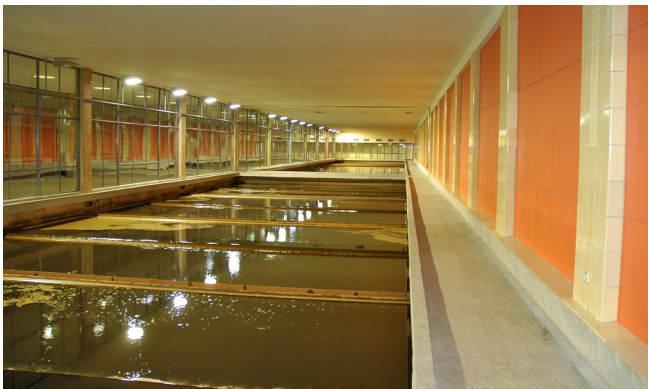
装满水的过滤池——过滤池柱满后测试管道系统的密封性